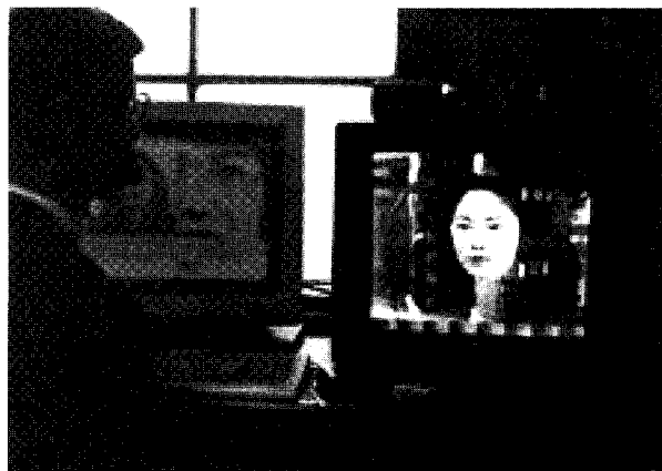
図2 初期のキャラクターエージェント

また、その頃の日本では携帯電話の Web 技術が進歩しており、多くのユーザが有料コンテンツを利用するような状況であった。そこに着目した氏はあるベンチャー企業と協力し、携帯電話用の MPML-Mobile による携帯コンテンツを KDDI-au 公式サービスにした。これはビ